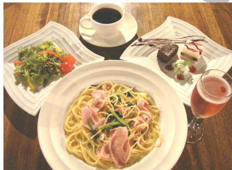
生ハムと後志産ほうれん草のパスタ セージバター風味