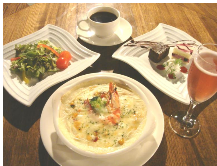
後志産米ほしのゆめのエビドリア