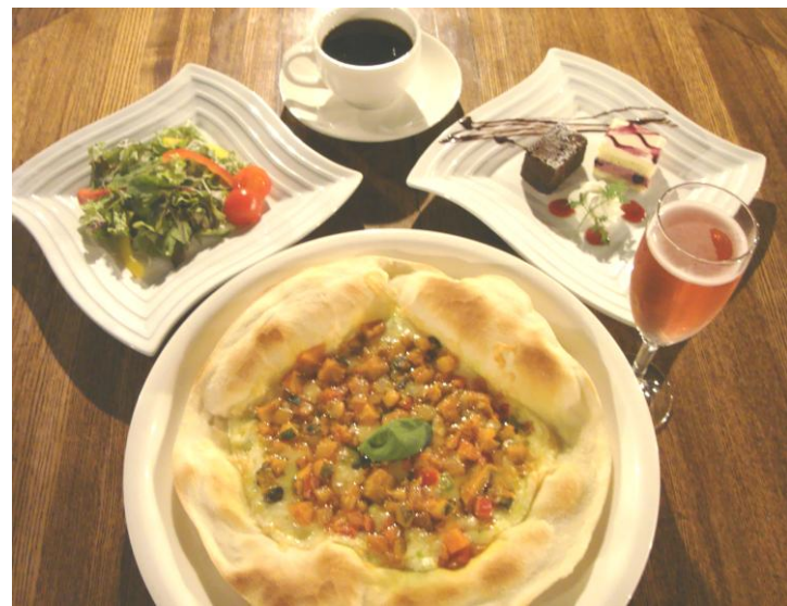
道産野菜を使ったラトウイユのジェノバ風ピザ

道産食材をふんだんに使ったメインメニュー（自慢の薄焼きピザ・茹でたてパスタ・あつあつドリア）からお好きな一点をチョイス。選べる食前酒と限定デザートも付いたセットで、素敵なお時間を過ごして下さい。